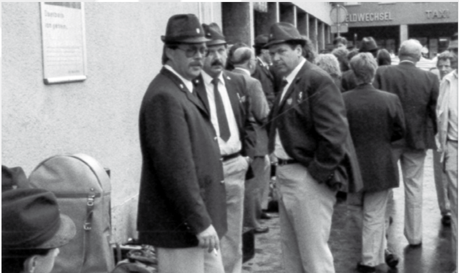
gespanntes Warten, Ausflug nach Innsbruck 1989