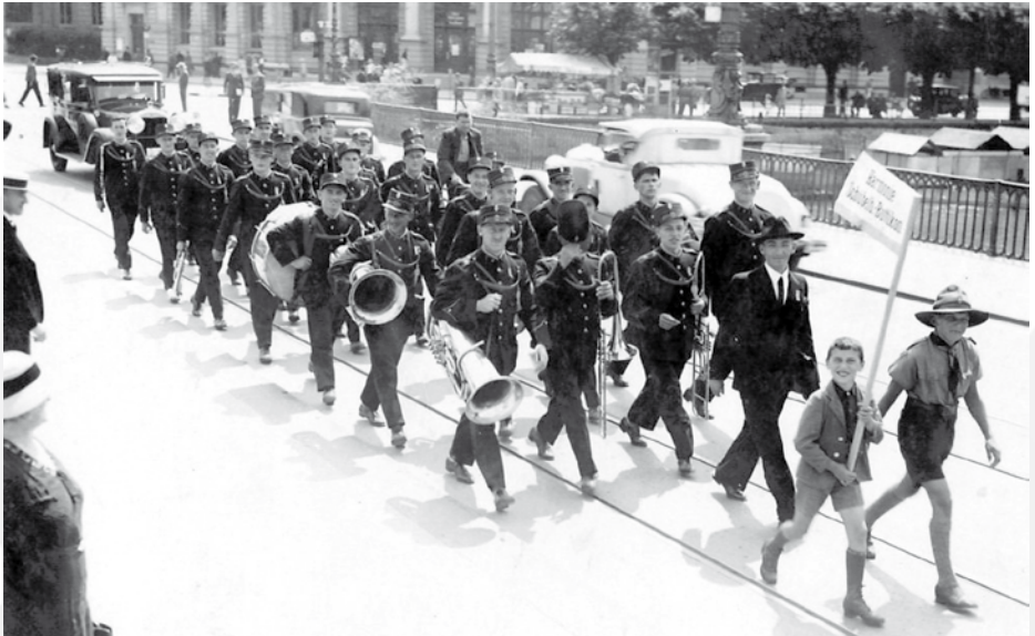
Erfolg am Eidgenössischen in Luzern 1935: „Das Kampfgericht hat dem Musikverein ‚Harmonie Schübelbach-Buttikon‘ der 4. Klasse den 1. Rang mit 92 Punkten [...] zuerkannt.“