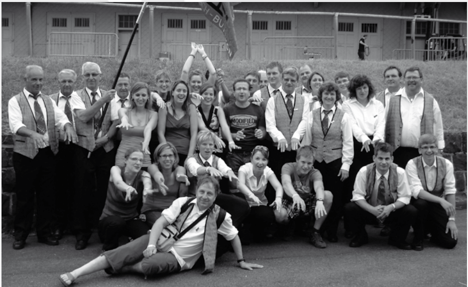
Sieg! Gruppenbild nach der Preisverleihung am Schwyzer Kantonalen Musikfest 2010 in Seewen Die Harmoniemusik Schübelbach-Buttikon erreichte den ersten Rang!

So stehe ich heute mit Stolz der Harmoniemusik Schübelbach als Präsidentin vor. Wir zählen aktuell 29 Aktivmitglieder sowie 16 nicht mehr aktiv im Verein musizierende Ehrenmitglieder. Der Verein ist klein, die Kameradschaft hervorragend und die musikalische Leistung auf unserem Niveau top. Unser 100-jähriges Bestehen wollen wir genau in diesem Rahmen feiern: klein aber fein. Nicht mit einem lauten Fest, aber mit einem tollen Konzert am 19. November 2011!