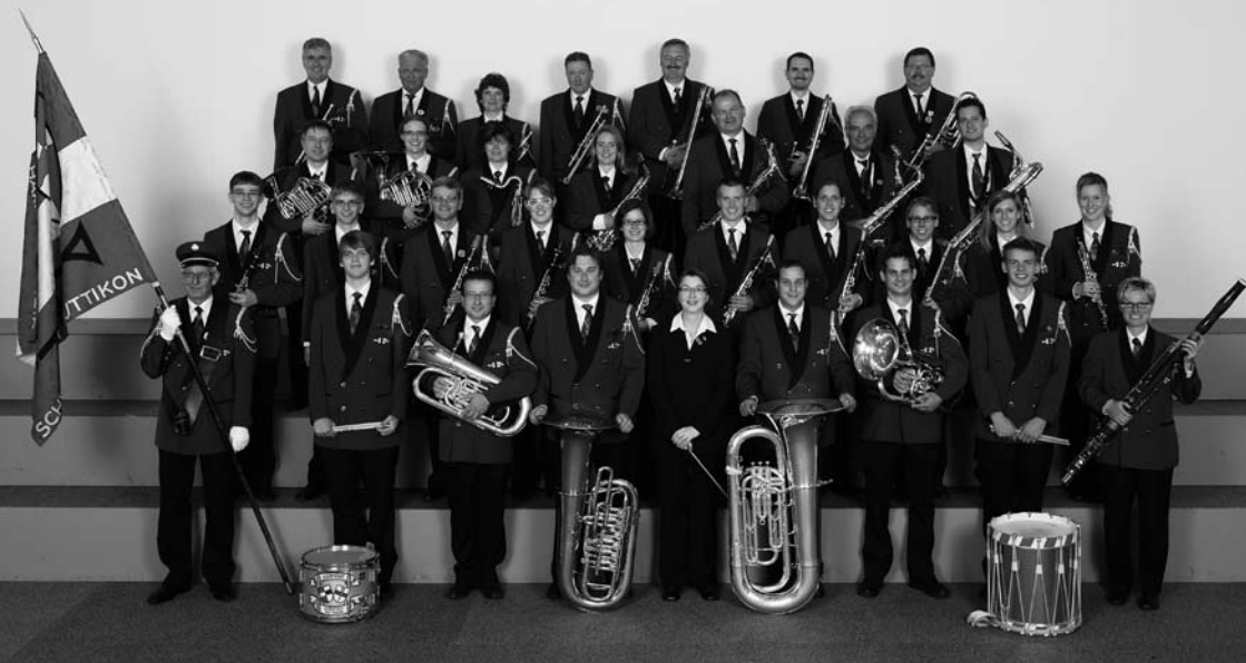
Harmoniemusik Schübelbach-Buttikon am Eidgenössischen Musikfest 2011 in St. Gallen