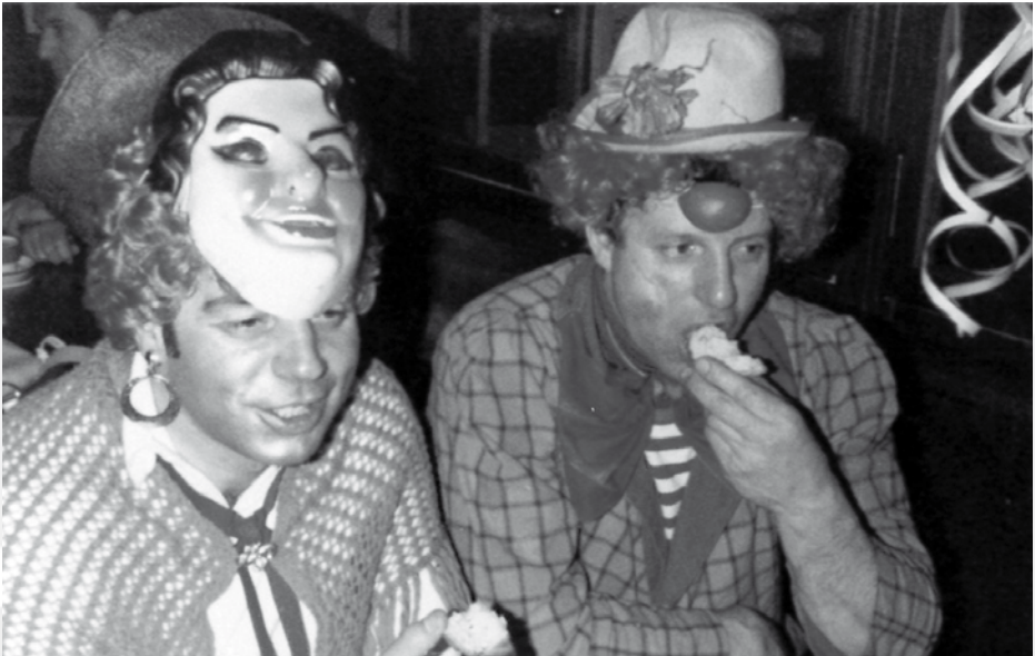
zwei gänzlich unkenntliche Wurst-Musikanten