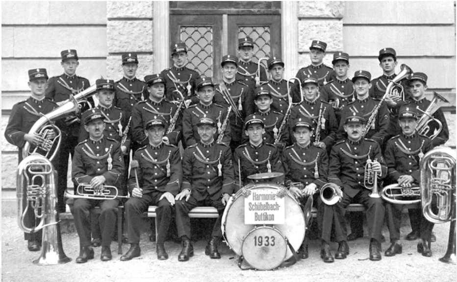
Neuuniformierung 1933: Vereinsfoto vor dem Schulhaus Dorf in Schübelbach