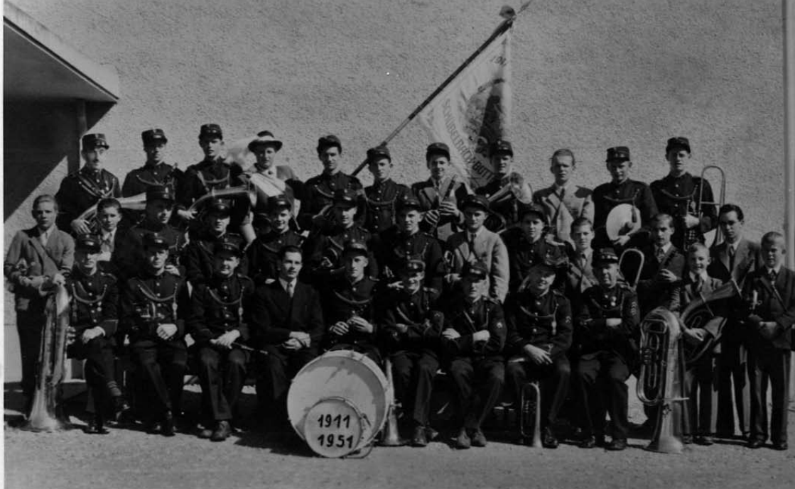
Harmoniemusik Schübelbach-Buttikon im Jahre 1951, damals noch mit der alten Vereinsfahne