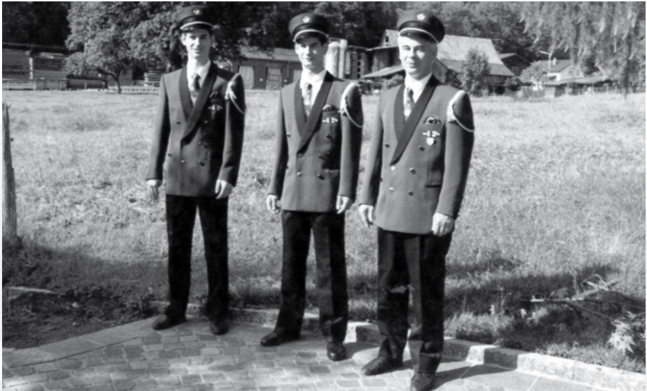
stolze Musikanten anlässlich Neuuniformierung 1993